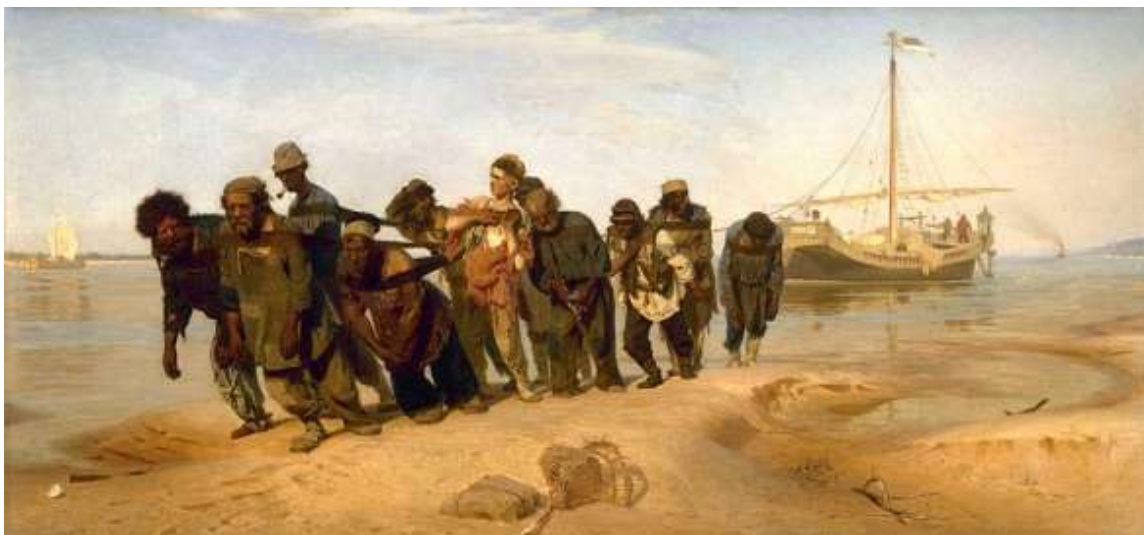
Слика руског реалисте Иље Рјепина „Бурлаци на Волги“

6. потреба да се стварност у уметности сагледа критички и прикаже верно, тачно и свеобухватно.